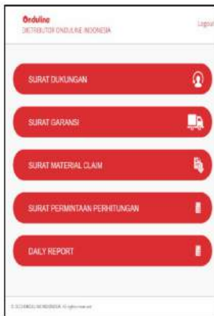
Pilih "Surat Garansi"