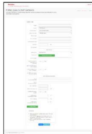
Isi data sesuai kondisi pemasangan